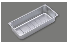
> Weblink 40.000.912.00 / CHF 106.- Colander, perforated