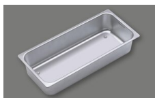
> Weblink 40.001.289.00 / CHF 106.- Colander, unperforated