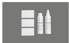
> Weblink 40.001.509.00 / CHF 29.- Easy Care cleaning kit for granite sinks