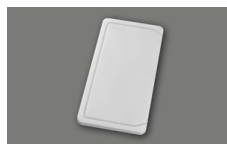
> Weblink 40.001.277.00 / CHF 151.- Chopping board, made of plastic