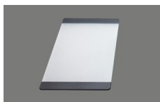
> Weblink 40.000.909.00 / CHF 151.- Chopping board, made of glass, white