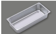
> Weblink 40.001.289.00 / CHF 106.- Colander, unperforated