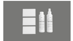
> Weblink 40.001.509.00 / CHF 29.- Easy Care cleaning kit for granite sinks