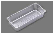
> Weblink 40.000.912.00 / CHF 106.- Colander, perforated