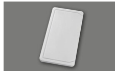
> Weblink 40.001.277.00 / CHF 151.- Chopping board, made of plastic