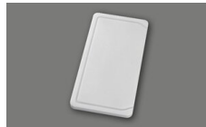
> Weblink 40.001.277.00 / CHF 151.- Chopping board, made of plastic