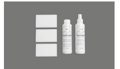
> Weblink 40.001.509.00 / CHF 29.- Easy Care cleaning kit for granite sinks