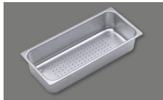
> Weblink 40.000.912.00 / CHF 106.- Colander, perforated