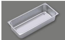
> Weblink 40.001.289.00 / CHF 106.- Colander, unperforated