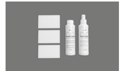
> Weblink 40.001.509.00 / CHF 29.- Easy Care cleaning kit for granite sinks