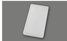
> Weblink 40.001.277.00 / CHF 151.- Chopping board, made of plastic