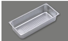
> Weblink 40.000.912.00 / CHF 106.- Colander, perforated