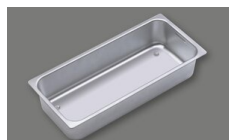
> Weblink 40.001.289.00 / CHF 106.- Panier amovible, non percé