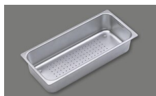
> Weblink 40.000.912.00 / CHF 106.- Panier amovible, percé