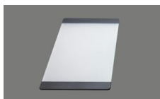
> Weblink 40.000.909.00 / CHF 151.- Planche à découper, en verre, blanc