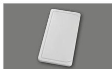
> Weblink 40.001.277.00 / CHF 151.- Planche à découper, synthétique