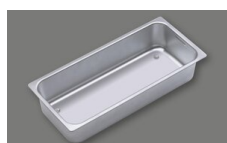
> Weblink 40.001.289.00 / CHF 106.- Panier amovible, non percé