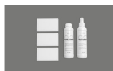
> Weblink 40.001.509.00 / CHF 29.- Set de nettoyage Easy Care pour éviers en granite