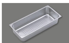
> Weblink 40.000.912.00 / CHF 106.- Panier amovible, percé