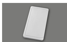
> Weblink 40.001.277.00 / CHF 151.- Planche à découper, synthétique