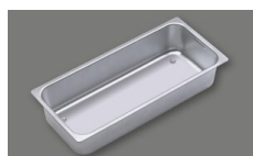
> Weblink 40.001.289.00 / CHF 106.- Panier amovible, non percé