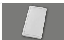
> Weblink 40.001.277.00 / CHF 151.- Planche à découper, synthétique