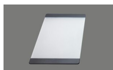
> Weblink 40.000.909.00 / CHF 151.- Planche à découper, en verre, blanc