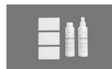
> Weblink 40.001.509.00 / CHF 29.- Set de nettoyage Easy Care pour éviers en granite