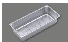
> Weblink 40.000.912.00 / CHF 106.- Panier amovible, percé