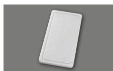
> Weblink 40.001.277.00 / CHF 151.- Planche à découper, synthétique