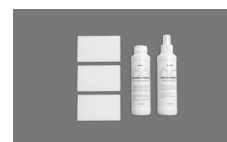
> Weblink 40.001.509.00 / CHF 29.- Set de nettoyage Easy Care pour éviers en granite