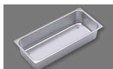
> Weblink 40.001.289.00 / CHF 106.- Panier amovible, non percé