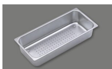
> Weblink 40.000.912.00 / CHF 106.- Panier amovible, percé

Retrouvez l'ensemble des accessoires ici > Weblink