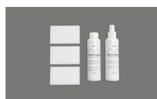
> Weblink 40.001.509.00 / CHF 29.- Set de nettoyage Easy Care pour éviers en granite