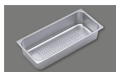
> Weblink 40.000.912.00 / CHF 106.- Panier amovible, percé