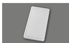
> Weblink 40.001.277.00 / CHF 151.- Planche à découper, synthétique