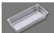
> Weblink 40.001.289.00 / CHF 106.- Panier amovible, non percé