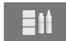
> Weblink 40.001.509.00 / CHF 29.- Set de nettoyage Easy Care pour éviers en granite