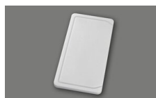
> Weblink 40.001.277.00 / CHF 151.- Planche à découper, synthétique