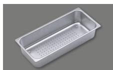
> Weblink 40.000.912.00 / CHF 106.- Panier amovible, percé