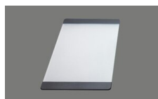
> Weblink 40.000.909.00 / CHF 151.- Planche à découper, en verre, blanc