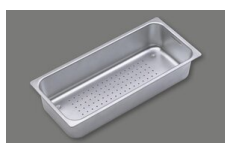
> Weblink 40.000.912.00 / CHF 106.- Panier amovible, percé