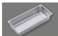
> Weblink 40.001.289.00 / CHF 106.- Panier amovible, non percé