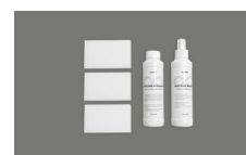
> Weblink 40.001.509.00 / CHF 29.- Set de nettoyage Easy Care pour éviers en granite