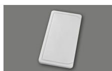
> Weblink 40.001.277.00 / CHF 151.- Planche à découper, synthétique