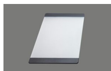
> Weblink 40.000.909.00 / CHF 151.- Planche à découper, en verre, blanc