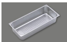
> Weblink 40.000.912.00 / CHF 106.- Panier amovible, percé