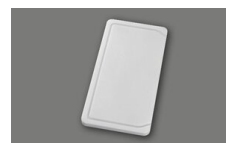
> Weblink 40.001.277.00 / CHF 151.- Planche à découper, synthétique