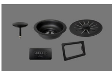
> Weblink 40.002.560.00 / CHF 319.- 3 ½" Extra plate, type S | Noir mat