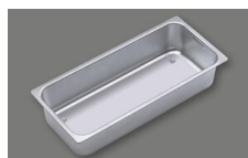
> Weblink 40.001.289.00 / CHF 106.- Panier amovible, non percé