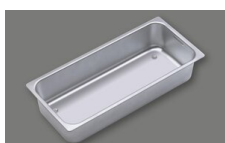
> Weblink 40.001.289.00 / CHF 106.- Panier amovible, non percé