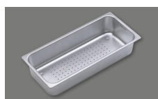
> Weblink 40.000.912.00 / CHF 106.- Panier amovible, percé