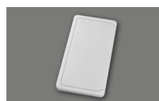
> Weblink 40.001.277.00 / CHF 151.- Planche à découper, synthétique