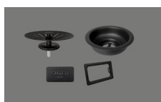
> Weblink 40.002.561.00 / CHF 311.- 3 ½" Tipo, type S | Noir mat