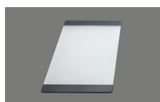
> Weblink 40.000.909.00 / CHF 151.- Planche à découper, en verre, blanc