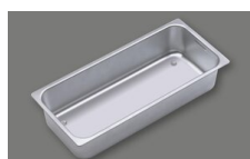
> Weblink 40.001.289.00 / CHF 106.- Panier amovible, non percé