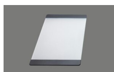
> Weblink 40.000.909.00 / CHF 151.- Planche à découper, en verre, blanc