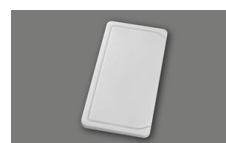
> Weblink 40.001.277.00 / CHF 151.- Planche à découper, synthétique