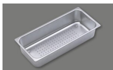
> Weblink 40.000.912.00 / CHF 106.- Panier amovible, percé