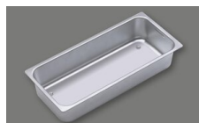
> Weblink 40.001.289.00 / CHF 106.- Panier amovible, non percé