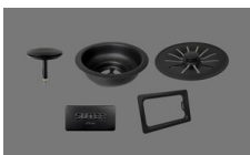
> Weblink 40.002.560.00 / CHF 319.- 3 ½" Extra plate, type S | Noir mat