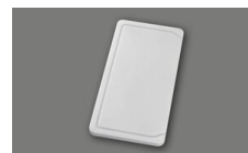
> Weblink 40.001.277.00 / CHF 151.- Planche à découper, synthétique