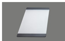
> Weblink 40.000.909.00 / CHF 151.- Planche à découper, en verre, blanc