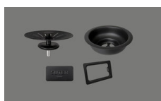
> Weblink 40.002.561.00 / CHF 311.- 3 1/2" Tipo, type S | Noir mat