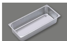
> Weblink 40.001.289.00 / CHF 106.- Panier amovible, non percé