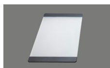
> Weblink 40.000.909.00 / CHF 151.- Planche à découper, en verre, blanc