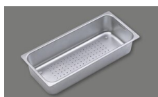
> Weblink 40.000.912.00 / CHF 106.- Panier amovible, percé