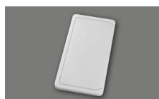
> Weblink 40.001.277.00 / CHF 151.- Planche à découper, synthétique