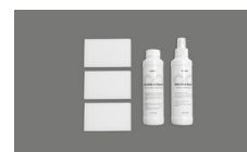
> Weblink 40.001.509.00 / CHF 29.- Set de nettoyage Easy Care pour éviers en granite