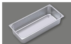
> Weblink 40.001.289.00 / CHF 106.- Panier amovible, non percé