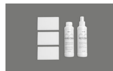
> Weblink 40.001.509.00 / CHF 29.- Set de nettoyage Easy Care pour éviers en granite