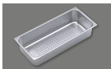
> Weblink 40.000.912.00 / CHF 106.- Panier amovible, percé