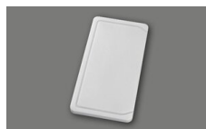
> Weblink 40.001.277.00 / CHF 151.- Planche à découper, synthétique