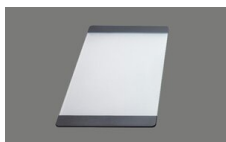
> Weblink 40.000.909.00 / CHF 151.- Planche à découper, en verre, blanc