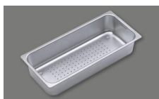
> Weblink 40.000.912.00 / CHF 106.- Panier amovible, percé