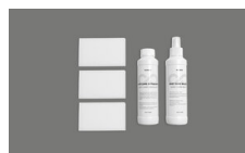
> Weblink 40.001.509.00 / CHF 29.- Set de nettoyage Easy Care pour éviers en granite