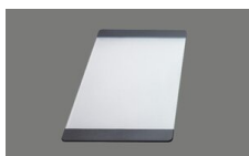
> Weblink 40.000.909.00 / CHF 151.- Planche à découper, en verre, blanc