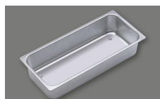
> Weblink 40.001.289.00 / CHF 106.- Panier amovible, non percé