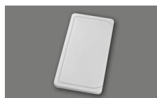
> Weblink 40.001.277.00 / CHF 151.- Planche à découper, synthétique