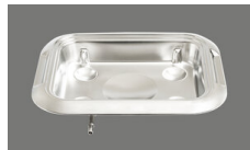
> Weblink 500.000.116.00 / CHF 4.- Plaque