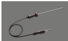
> Weblink 500.000.048.00 / CHF 4.- Sonde de cuisson