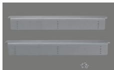
> Weblink 500.000.074.00 / CHF 60.- Kit d'équerres d'appui