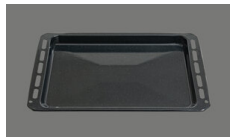
> Weblink 500.000.112.00 / CHF 4.- Lèche-frite 30 mm