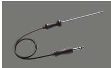
> Weblink 500.000.048.00 / CHF 4.- Sonde de cuisson