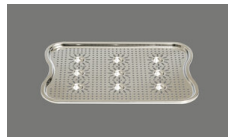
> Weblink 500.000.118.00 / CHF 4.- Plaque perforée