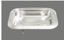
> Weblink 500.000.116.00 / CHF 4.- Plaque