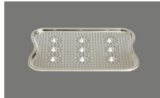
> Weblink 500.000.118.00 / CHF 4.- Plaque perforée