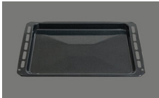
> Weblink 500.000.112.00 / CHF 4.- Lèche-frite 30 mm