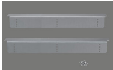
> Weblink 500.000.074.00 / CHF 60.- Kit d'équerres d'appui