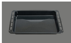
> Weblink 500.000.115.00 / CHF 96.- Lèche-frite profond 50 mm