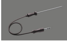
> Weblink 500.000.048.00 / CHF 3.- Sonde de cuisson