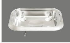
> Weblink 500.000.116.00 / CHF 3.- Plaque