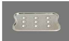
> Weblink 500.000.118.00 / CHF 3.- Plaque perforée