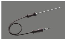
> Weblink 500.000.048.00 / CHF 3.- Sonde de cuisson