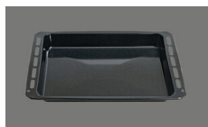
> Weblink 500.000.115.00 / CHF 96.- Lèche-frite profond 50 mm