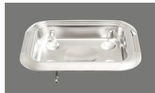
> Weblink 500.000.116.00 / CHF 3.- Plaque