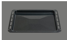
> Weblink 500.000.112.00 / CHF 3.- Lèche-frite 30 mm