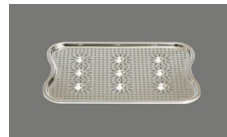
> Weblink 500.000.118.00 / CHF 3.- Plaque perforée