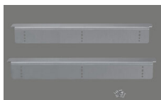
> Weblink 500.000.074.00 / CHF 60.- Kit d'équerres d'appui