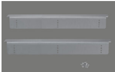
> Weblink 500.000.074.00 / CHF 60.- Kit d'équerres d'appui