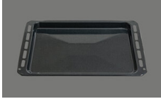
> Weblink 500.000.112.00 / CHF 3.- Lèche-frite 30 mm