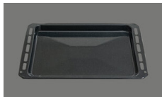
> Weblink 500.000.112.00 / CHF 3.- Lèche-frite 30 mm