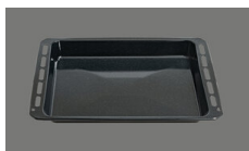
> Weblink 500.000.115.00 / CHF 96.- Lèche-frite profond 50 mm