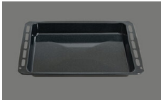
> Weblink 500.000.115.00 / CHF 96.- Lèche-frite profond 50 mm