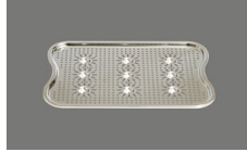
> Weblink 500.000.118.00 / CHF 3.- Plaque perforée