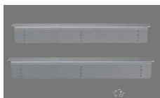
> Weblink 500.000.074.00 / CHF 60.- Kit d'équerres d'appui