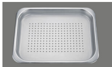
> Weblink 500.000.047.00 / CHF 2.- Plaque perforée