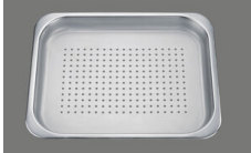
> Weblink 500.000.047.00 / CHF 2.- Plaque perforée