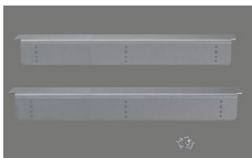
> Weblink 500.000.074.00 / CHF 60.- Kit d'équerres d'appui