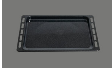
> Weblink 500.000.119.00 / CHF 2.- Plaque de cuisson 20 mm