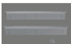
> Weblink 500.000.074.00 / CHF 60.- Kit d'équerres d'appui