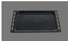
> Weblink 500.000.119.00 / CHF 2.- Plaque de cuisson 20 mm