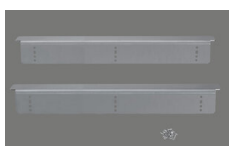
> Weblink 500.000.074.00 / CHF 60.- Kit d'équerres d'appui