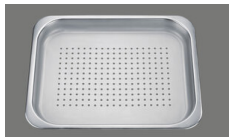
> Weblink 500.000.047.00 / CHF 2.- Plaquette perforée