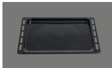
> Weblink 500.000.119.00 / CHF 2.- Plaquette de cuisson 20 mm