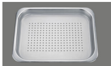
> Weblink 500.000.047.00 / CHF 3.- Plaque perforée