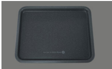
> Weblink 500.000.041.00 / CHF 1.- Plateau céramique