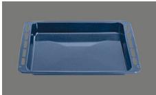
> Weblink 500.000.040.00 / CHF 88.- Lèche-frite profond 50 mm