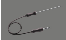
> Weblink 500.000.173.00 / CHF 4.- Sonde de cuisson