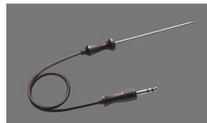
> Weblink 500.000.173.00 / CHF 4.- Sonde de cuisson