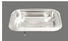
> Weblink 500.000.116.00 / CHF 4.- Plaque