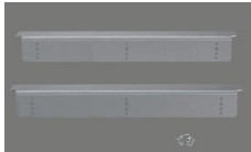
> Weblink 500.000.074.00 / CHF 60.- Kit d'équerres d'appui