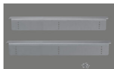
> Weblink 500.000.074.00 / CHF 60.- Kit d'équerres d'appui