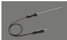
> Weblink 500.000.173.00 / CHF 4.- Sonde de cuisson