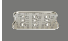
> Weblink 500.000.118.00 / CHF 4.- Plaque perforée