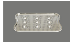
> Weblink 500.000.118.00 / CHF 4.- Plaque perforée