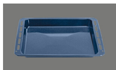
> Weblink 500.000.040.00 / CHF 88.- Lèche-frite profond 50 mm