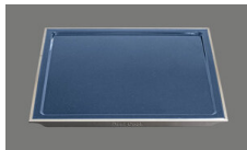
> Weblink 500.000.046.00 / CHF 4.- Diviseur cavité