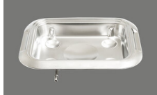
> Weblink 500.000.116.00 / CHF 4.- Plaque