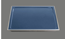
> Weblink 500.000.046.00 / CHF 4.- Diviseur cavité