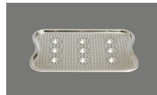
> Weblink 500.000.118.00 / CHF 4.- Plaque perforée