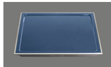
> Weblink 500.000.046.00 / CHF 4.- Diviseur cavité