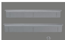
> Weblink 500.000.074.00 / CHF 60.- Kit d'équerres d'appui