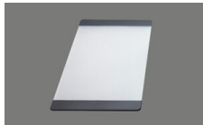
> Weblink 40.000.909.00 / CHF 151.- Planche à découper, en verre, blanc