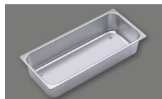
> Weblink 40.001.289.00 / CHF 106.- Panier amovible, non percé