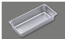
> Weblink 40.000.912.00 / CHF 106.- Panier amovible, percé