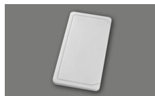
> Weblink 40.001.277.00 / CHF 151.- Planche à découper, synthétique