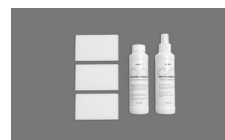
> Weblink 40.001.509.00 / CHF 29.- Set de nettoyage Easy Care pour éviers en granite