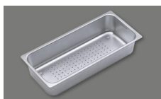
> Weblink 40.000.912.00 / CHF 106.- Panier amovible, percé