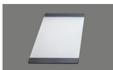
> Weblink 40.000.909.00 / CHF 151.- Planche à découper, en verre, blanc