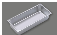
> Weblink 40.001.289.00 / CHF 106.- Panier amovible, non percé