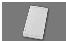
> Weblink 40.001.277.00 / CHF 151.- Planche à découper, synthétique