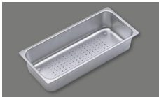
> Weblink 40.000.912.00 / CHF 106.- Panier amovible, percé