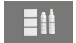
> Weblink 40.001.509.00 / CHF 29.- Set de nettoyage Easy Care pour éviers en granite