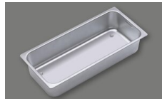
> Weblink 40.001.289.00 / CHF 106.- Panier amovible, non percé