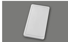
> Weblink 40.001.277.00 / CHF 151.- Planche à découper, synthétique