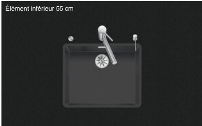
Éléments inférieurs 55 cm