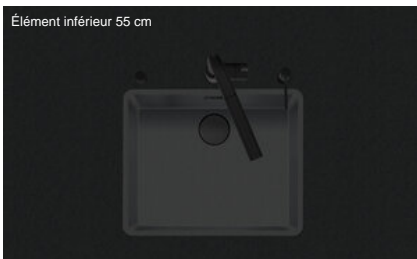
Élément inférieur 55 cm