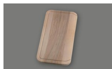
> Weblink 40.001.147.00 / CHF 151.- Planche à découper, en bois