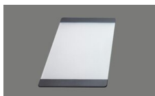
> Weblink 40.000.915.00 / CHF 151.- Planche à découper, en verre, blanc