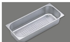
> Weblink 40.000.914.00 / CHF 106.- Panier amovible, percé