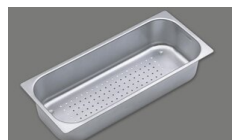
> Weblink 40.000.914.00 / CHF 106.- Panier amovible, percé