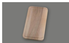
> Weblink 40.001.147.00 / CHF 151.- Planche à découper, en bois