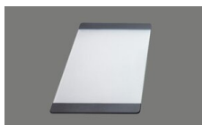
> Weblink 40.000.915.00 / CHF 151.- Planche à découper, en verre, blanc