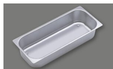
> Weblink 40.001.290.00 / CHF 106.- Panier amovible, non percé