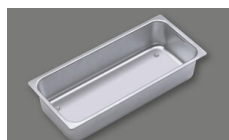
> Weblink 40.001.289.00 / CHF 106.- Vaschetta, non forato