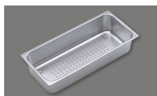
> Weblink 40.000.912.00 / CHF 106.- Vaschetta, forato