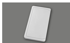
> Weblink 40.001.277.00 / CHF 151.- Tagliere, sintetico