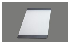
> Weblink 40.000.909.00 / CHF 151.- Tagliere, in vetro, bianco