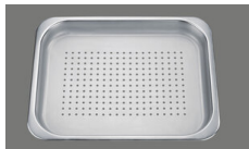
> Weblink 500.000.047.00 / CHF 2.- Contenitore forato per cottura a vapore