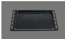
> Weblink 500.000.119.00 / CHF 2.- Teglia da forno 20 mm