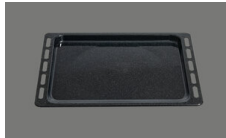
> Weblink 500.000.119.00 / CHF 2.- Teglia da forno 20 mm