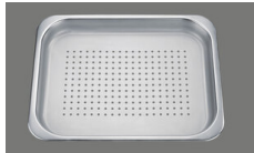
> Weblink 500.000.047.00 / CHF 2.- Contenitore forato per cottura a vapore