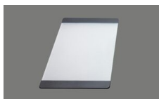
> Weblink 40.000.909.00 / CHF 151.- Tagliere, in vetro, bianco