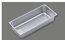
> Weblink 40.000.912.00 / CHF 106.- Vaschetta, forato