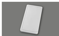
> Weblink 40.001.277.00 / CHF 151.- Tagliere, sintetico