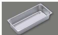
> Weblink 40.001.289.00 / CHF 106.- Vaschetta, non forato