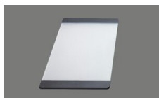
> Weblink 40.000.909.00 / CHF 151.- Tagliere, in vetro, bianco