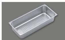
> Weblink 40.000.912.00 / CHF 106.- Vaschetta, forato