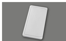
> Weblink 40.001.277.00 / CHF 151.- Tagliere, sintetico