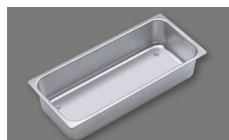
> Weblink 40.001.289.00 / CHF 106.- Vaschetta, non forato