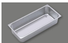
> Weblink 40.001.289.00 / CHF 106.- Vaschetta, non forato