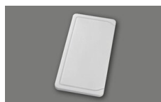
> Weblink 40.001.277.00 / CHF 151.- Tagliere, sintetico