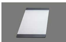
> Weblink 40.000.909.00 / CHF 151.- Tagliere, in vetro, bianco