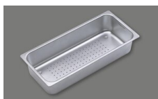
> Weblink 40.000.912.00 / CHF 106.- Vaschetta, forato