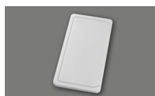
> Weblink 40.001.277.00 / CHF 151.- Tagliere, sintetico