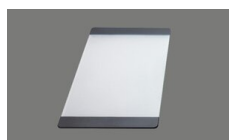
> Weblink 40.000.909.00 / CHF 151.- Tagliere, in vetro, bianco