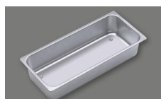
> Weblink 40.001.289.00 / CHF 106.- Vaschetta, non forato