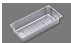
> Weblink 40.000.912.00 / CHF 106.- Vaschetta, forato