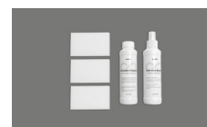
> Weblink 40.001.509.00 / CHF 29.- Kit di pulizia Easy Care per lavelli in granito