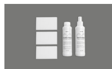
> Weblink 40.001.509.00 / CHF 29.- Kit di pulizia Easy Care per lavelli in granito