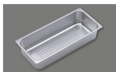
> Weblink 40.000.912.00 / CHF 106.- Vaschetta, forato