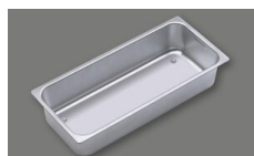
> Weblink 40.001.289.00 / CHF 106.- Vaschetta, non forato