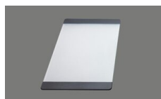
> Weblink 40.000.909.00 / CHF 151.- Tagliere, in vetro, bianco