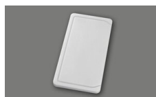
> Weblink 40.001.277.00 / CHF 151.- Tagliere, sintetico