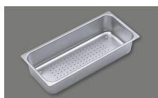
> Weblink 40.000.912.00 / CHF 106.- Vaschetta, forato