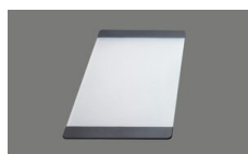
> Weblink 40.000.909.00 / CHF 151.- Tagliere, in vetro, bianco