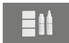
> Weblink 40.001.509.00 / CHF 29.- Kit di pulizia Easy Care per lavelli in granito