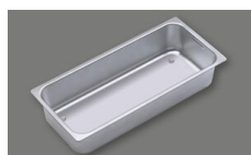
> Weblink 40.001.289.00 / CHF 106.- Vaschetta, non forato