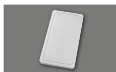
> Weblink 40.001.277.00 / CHF 151.- Tagliere, sintetico