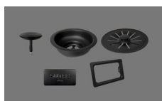
> Weblink 40.002.560.00 / CHF 319.- 3 ½" Salvaspazio, tipo S | Nero opaco