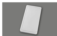
> Weblink 40.001.277.00 / CHF 151.- Tagliere, sintetico