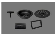
> Weblink 40.002.560.00 / CHF 319.- 3 1/2" Salvaspazio, tipo S | Nero opaco