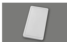
> Weblink 40.001.277.00 / CHF 151.- Tagliere, sintetico