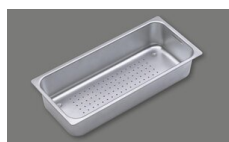
> Weblink 40.000.912.00 / CHF 106.- Vaschetta, forato