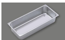
> Weblink 40.001.289.00 / CHF 106.- Vaschetta, non forato