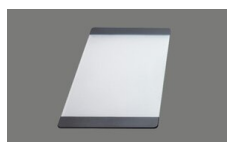
> Weblink 40.000.909.00 / CHF 151.- Tagliere, in vetro, bianco