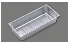
> Weblink 40.000.912.00 / CHF 106.- Vaschetta, forato