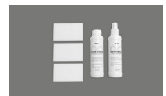
> Weblink 40.001.509.00 / CHF 29.- Kit di pulizia Easy Care per lavelli in granito