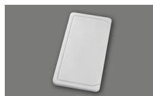
> Weblink 40.001.277.00 / CHF 151.- Tagliere, sintetico