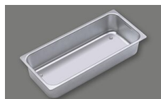
> Weblink 40.001.289.00 / CHF 106.- Vaschetta, non forato