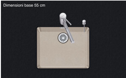
Dimensioni base 55 cm

Montaggio Lavelli sottopiano Modello DAN CP 50U/2 Materiale Cristalite Plus N. di articolo 10.104.784.00