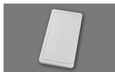
> Weblink 40.001.277.00 / CHF 151.- Tagliere, sintetico