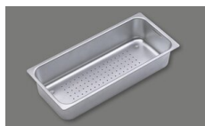
> Weblink 40.000.912.00 / CHF 106.- Vaschetta, forato