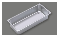
> Weblink 40.001.289.00 / CHF 106.- Vaschetta, non forato