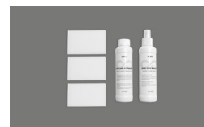
> Weblink 40.001.509.00 / CHF 29.- Kit di pulizia Easy Care per lavelli in granito