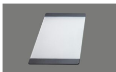
> Weblink 40.000.909.00 / CHF 151.- Tagliere, in vetro, bianco