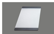
> Weblink 40.000.909.00 / CHF 151.- Tagliere, in vetro, bianco