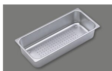
> Weblink 40.000.912.00 / CHF 106.- Vaschetta, forato