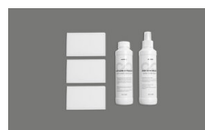
> Weblink 40.001.509.00 / CHF 29.- Kit di pulizia Easy Care per lavelli in granito