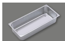
> Weblink 40.001.289.00 / CHF 106.- Vaschetta, non forato