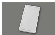
> Weblink 40.001.277.00 / CHF 151.- Tagliere, sintetico