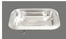
> Weblink 500.000.116.00 / CHF 4.- Contenitore di cottura