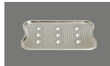
> Weblink 500.000.118.00 / CHF 4.- Contenitore di cottura forato