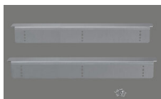
> Weblink 500.000.074.00 / CHF 60.- Set di squadrette di supporto