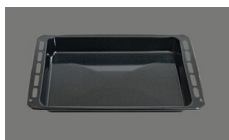
> Weblink 500.000.115.00 / CHF 96.- Teglia extra profonda 50 mm