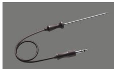
> Weblink 500.000.048.00 / CHF 4.- Sensore di temperatura al cuore