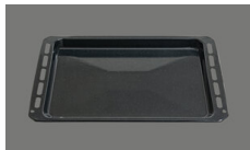
> Weblink 500.000.112.00 / CHF 4.- Teglia universale 30 mm