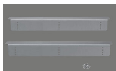
> Weblink 500.000.074.00 / CHF 60.- Set di squadrette di supporto