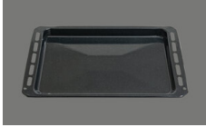
> Weblink 500.000.112.00 / CHF 3.- Teglia universale 30 mm