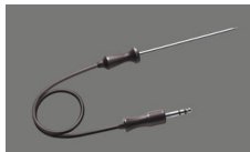
> Weblink 500.000.048.00 / CHF 3.- Sensore di temperatura al cuore