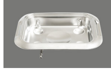
> Weblink 500.000.116.00 / CHF 3.- Contenitore di cottura