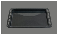
> Weblink 500.000.112.00 / CHF 3.- Teglia universale 30 mm