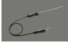
> Weblink 500.000.048.00 / CHF 3.- Sensore di temperatura al cuore