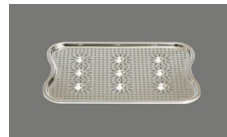
> Weblink 500.000.118.00 / CHF 3.- Contenitore di cottura forato