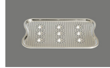
> Weblink 500.000.118.00 / CHF 3.- Contenitore di cottura forato