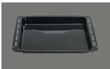
> Weblink 500.000.115.00 / CHF 96.- Teglia extra profonda 50 mm