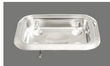
> Weblink 500.000.116.00 / CHF 3.- Contenitore di cottura